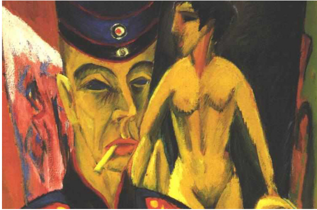
Ernst Ludwig Kirchner Selbstbildnis als Soldat | Allen Memorial Art Museum

Gästeführer/innen und Kirchenführer/innen nehmen eine herausragende Stellung im Rahmen des Tourismusangebotes vor Ort ein. Sie sind Botschafter/innen einer Region mit all ihren Besonderheiten von Kunst, Kultur und Natur.