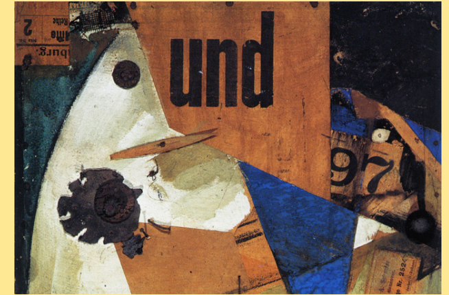
Kurt Schwitters Das Unbild | Centre Georges Pompidou