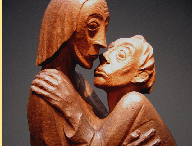
Ernst Barlach Das Wiedersehen (Christus und Thomas)

Bedingung für die Erlangung des Zertifikats „Kompetenz Kunst und Architektur der ersten Hälfte des 20. Jahrhunderts“ ist eine regelmäßige Teilnahme an mindestens 80% der Veranstaltungen sowie eine der Weiterbildung gemäße Prüfungsleistung.